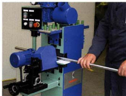
Smerigliatura di tubi e barre tonde Grinding operations on pipes and round bars