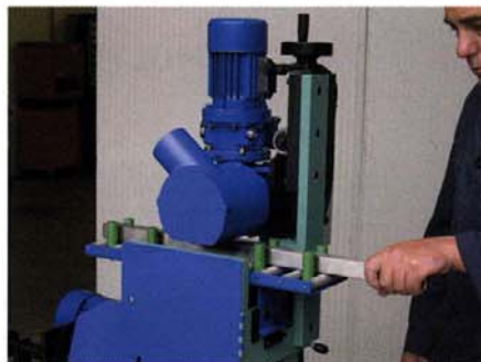
Smerigliatura di superfici piane diritte (optional) Grinding operations on straight flat surfaces (optional)