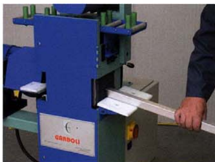
Operazioni di sbavatura e smussatura Deburring and chamfering operations