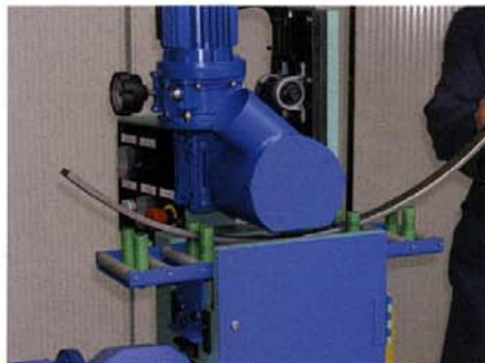
Smerigliatura di superfici piane curvate (optional) Grinding operations on bent flat surfaces (optional)